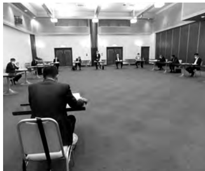
青年部会定時総会 6月3日