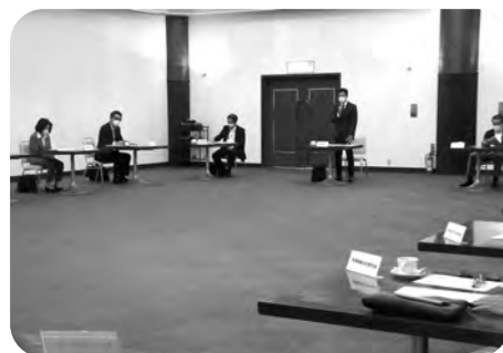
税務懇話会署長挨拶