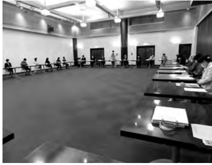
女性部会定時総会 5月19日