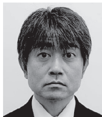
法人課税第2部門 統括国税調査官