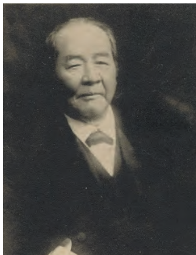
渋沢栄一肖像 (陸爵記念絵葉書部分)