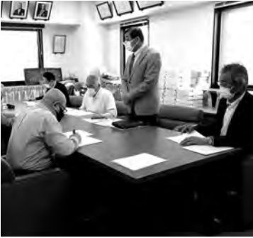
第1回税制委員会 5月10日