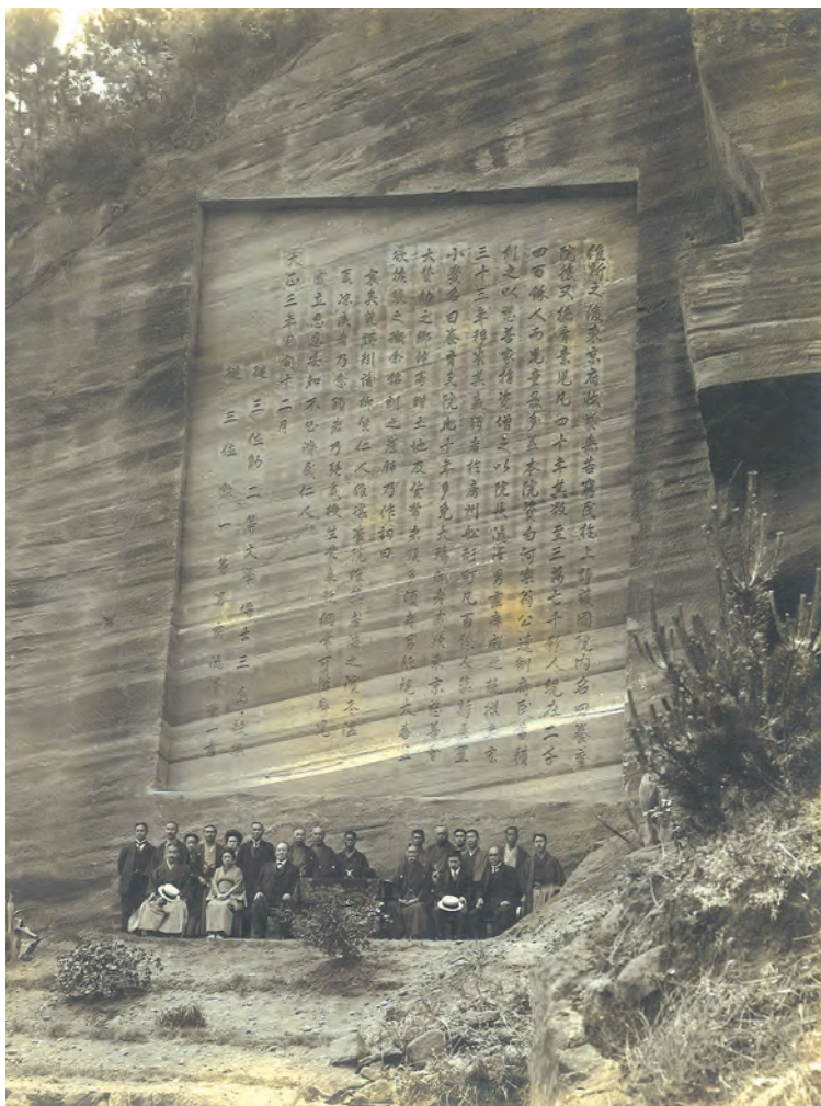
磨崖碑竣工記念写真