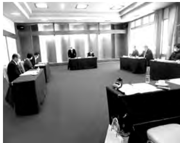
源泉研究部会定時総会 5月14日