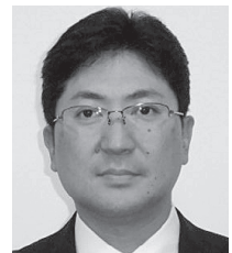
資産課税部門 統括国税調査官