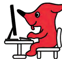
千葉県マスコットキャラクター チーバくん

eLTAXホームページの「よくあるご質問」: https://eltax.custhelp.com/