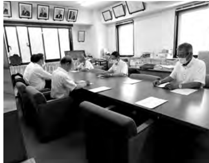
第1回広報委員会 7月19日