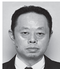
法人課税第1部門 統括国税調査官