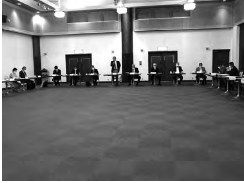
新年度第1回理事会 4月23日