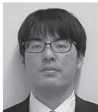
法人課税第1部門 (審理担当)