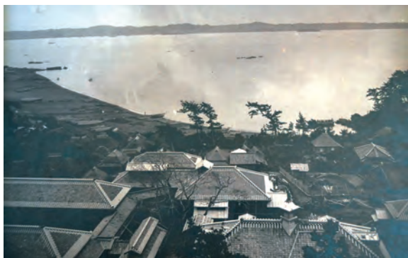
東京市養育院安房分院