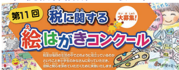
鋸南小学校、千倉小学校で実施