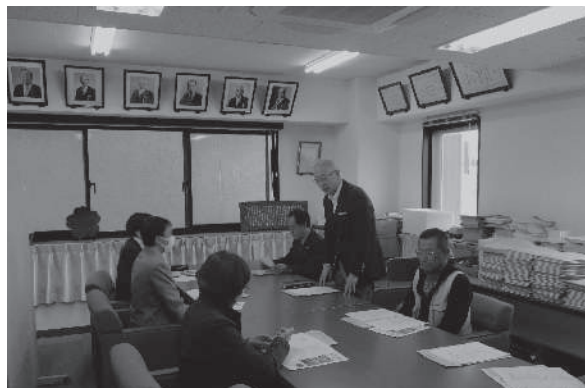
第2回広報委員会 11月14日