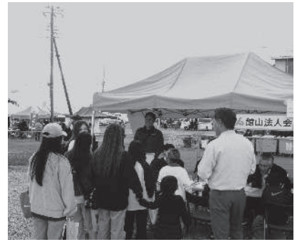
青年部会税金クイズ 11月16日