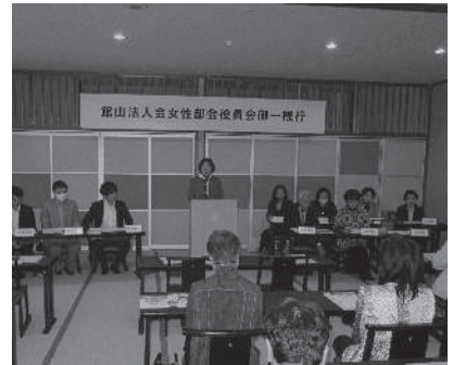
女性部会役員会 11月5日