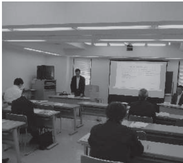
源泉研究部会 10月28日

「e-Tax」なら国税に関する申告や納税、申請・届出などの手続きがインターネットで行えます。